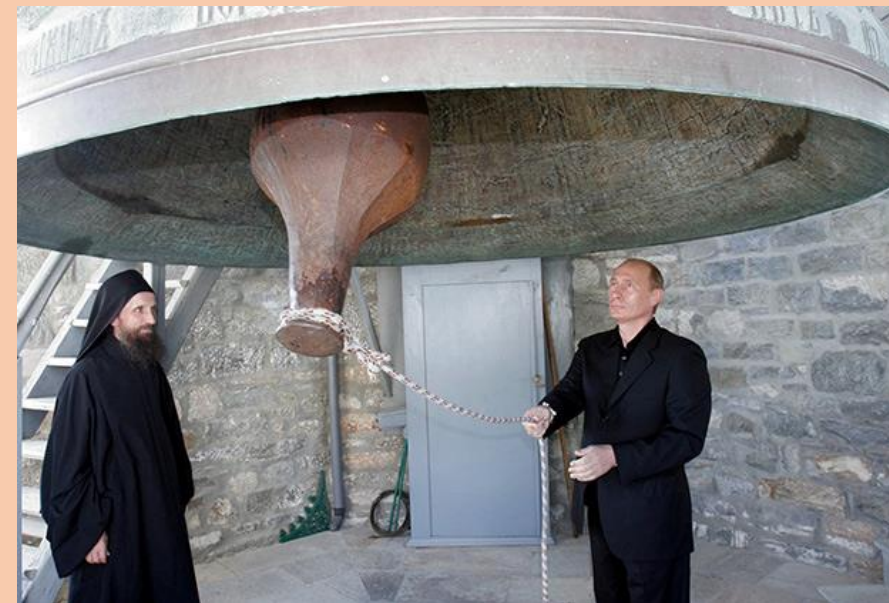
Владимир Путин на Святой горе Афон в 2005 году

Паломничество на Афон совершали Евгений Примаков, Сергей Шойгу, Сергей Степашин, Юрий Чайка, Георгий Полтавченко. Традицию таких поездок заложил бывший глава РЖД Владимир Якунин. В 2011 году учрежденный им Фонд Андрея Первозванного привозил в Россию с Афона пояс Пресвятой Богородицы. В очередь к этой реликвии выстроились три миллиона человек. За последний год Святую гору Афон посетили 11 тысяч граждан России.