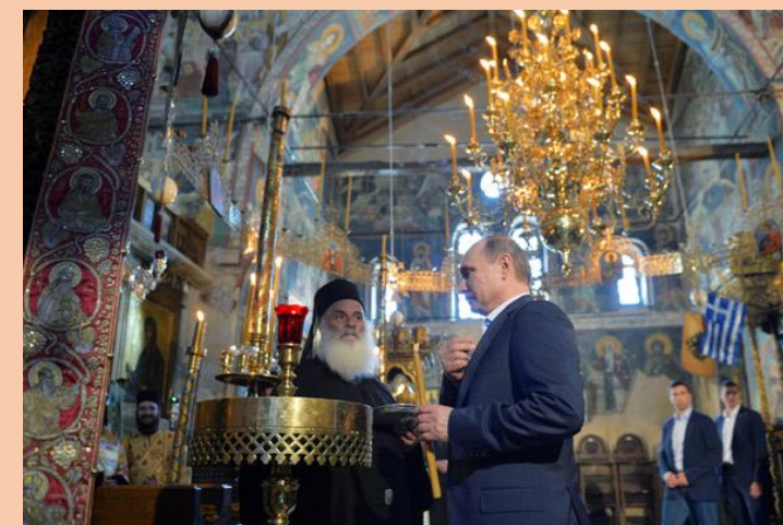
Владимир Путин в храме Успения Пресвятой Богородицына Святой горе Афон в 2016 г.