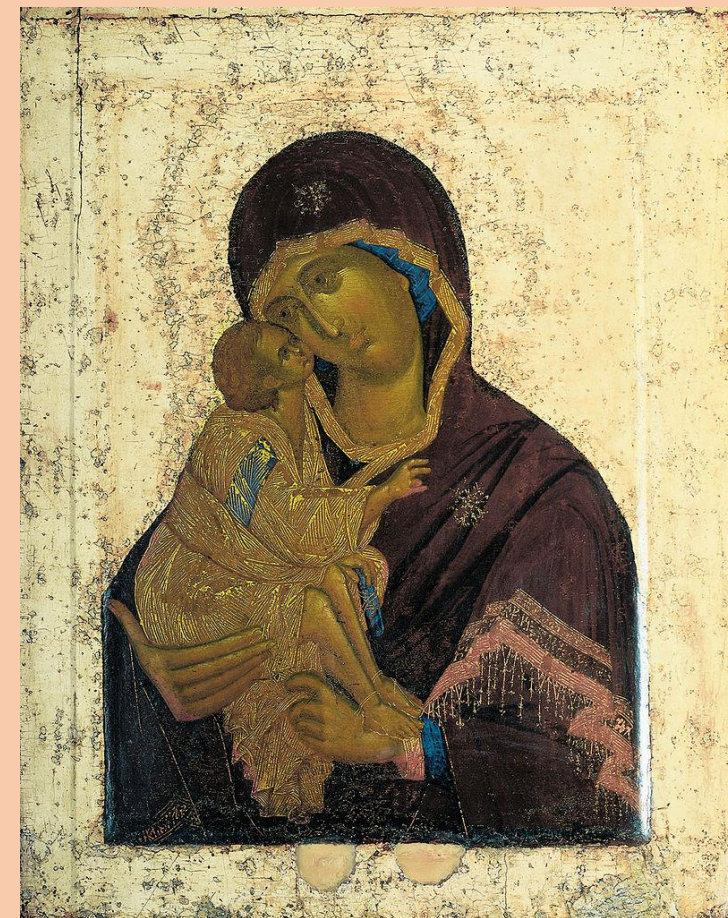
Донская икона Божьей Матери

Относительно икон, написанных Феофаном, не сохранилось чёткой информации. Традиционно его авторству приписывают «Успение Божьей Матери», «Донскую икону Божьей Матери», «Преображение Господне» и деисусный чин Благовещенского собора Кремля. Феофан Грек возглавлял роспись ряда московских церквей — это новая каменная церковь Рождества Богородицы в 1395 году, совместно с Семёном Чёрным и учениками, церковь святого Архангела Михаила в 1399 году, роспись которой выгорела во время нашествия Тохтамыша, и церковь Благовещения совместно со старцем Прохором с Городца и Андреем Рублёвым в 1405 году. Также Феофану иногда приписываются иконы деисусного чина из иконостаса Благовещенского собора. Главная особенность его в том, что это первый в России иконостас с фигурами в полный рост. Состоит иконостас из следующих икон: «Василий Великий», «Апостол Пётр», «Архангел Михаил», «Богоматерь», «Спас», «Иоанн Предтеча», «Архангел Гавриил», «Апостол Павел», «Иоанн Златоуст».