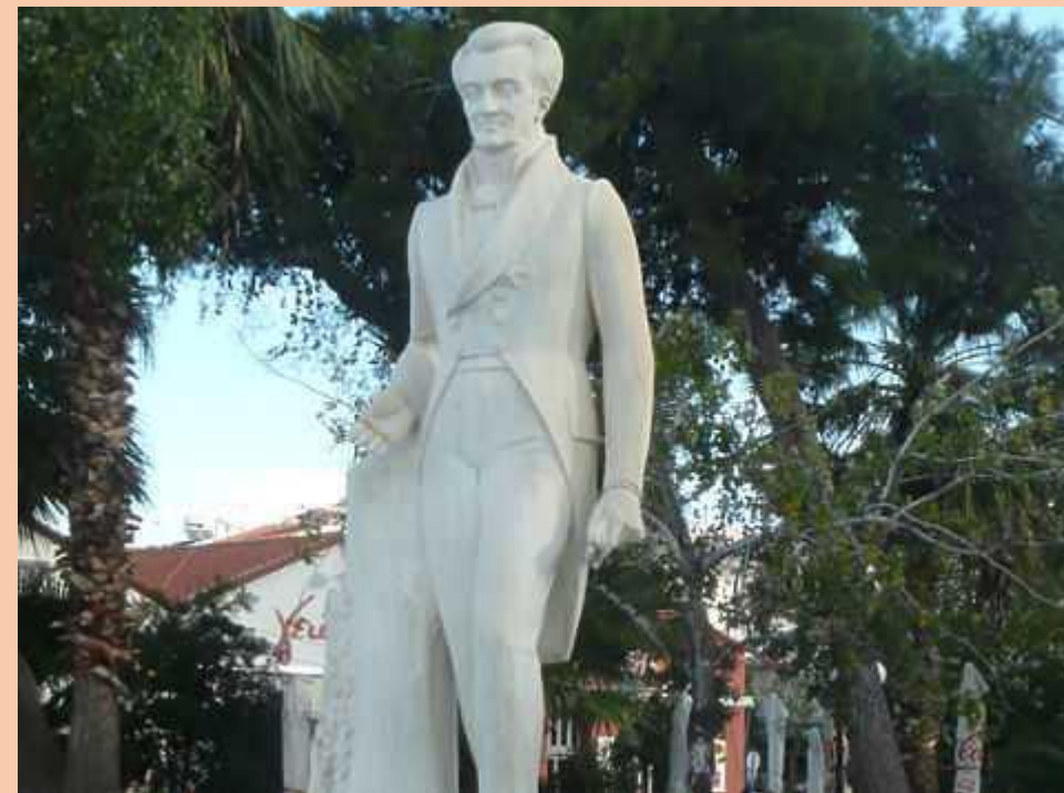
Памятник Иоанну Каподистрии в городе Нафплионе. Первый правитель независимой Греции был и главой МИД России.

Дружба между народами России и Греции уходит вглубь времен. Начиная с VIII века до н.э. с первых греческих поселений на берегах Черного моря, далее через века, объединенные одной религией и общими культурными традициями, наши народы поддерживали друг друга в борьбе за свободу и независимость. Во времена турецкой оккупации начало освободительного движения за независимость Греции было положено на русской земле. Первым греческим президентом был бывший министр иностранных дел России Иоаннис Каподистрия. Именно русская армия помогла одержать окончательную победу над турками. А через сто лет потомки русской аристократии, когда-то горячо поддержавшей освободительную борьбу греков, сами оказались в положении изгнанников и искали в Греции спасения от преследований большевиков. Оставшиеся в России греки во времена сталинского режима были подвергнуты насильственной депортации в Северный Казахстан