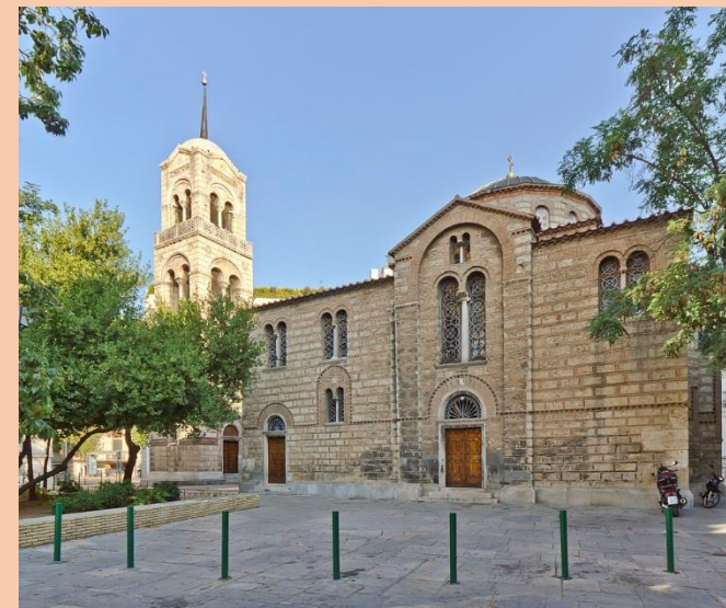
Русская православная церковь в Афинах

Статуя королевы Ольги имеет высоту 3,5 метра "изготовлена из гранита и бронзы, а также имеет таблички с историческими справками".