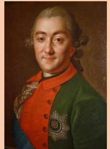
Портрет графа Алексея Григорьевича Орлова-Чесменского. Неизвестный я художник 18 века