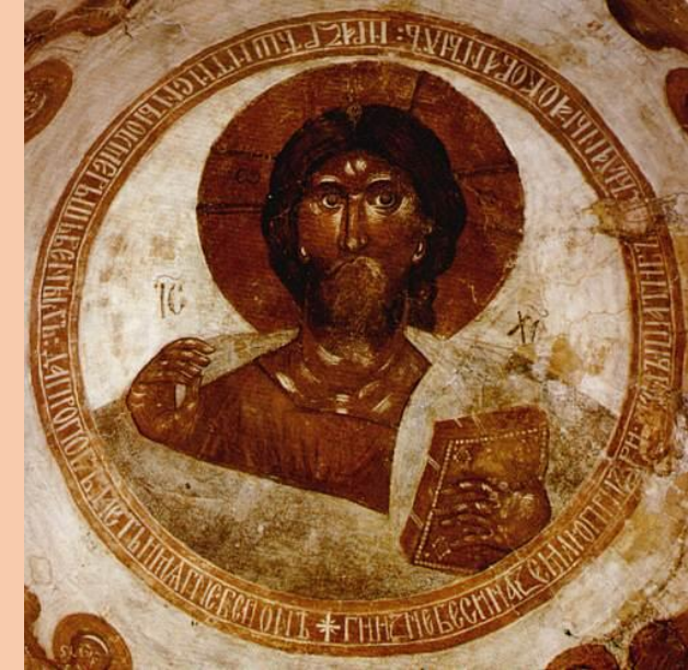
Спас Вседержитель. Роспись купола церкви Спаса Преображения на Ильине улице в Великом Новгороде. 1378 г.