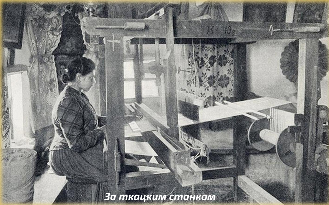
За ткацким станком

Особое место в традиционных ремеслах в начале прошлого века занимала обработка льняного сырья. Ведь в то время одежду очень часто шили именно из домотканого льняного полотна. Хлопковые и хлопчатобумажные ткани были фабричного производства и считались дорогими.