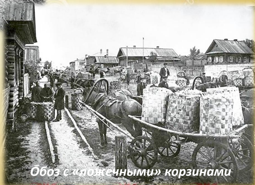
Обоз с «ложечными» корзинами

Ложкарную продукцию производили тысячи крестьян-кустарей, у каждого из которых была особая специализации: резчики, красильщики, лачилы (те, кто покрывал посуду лаком).