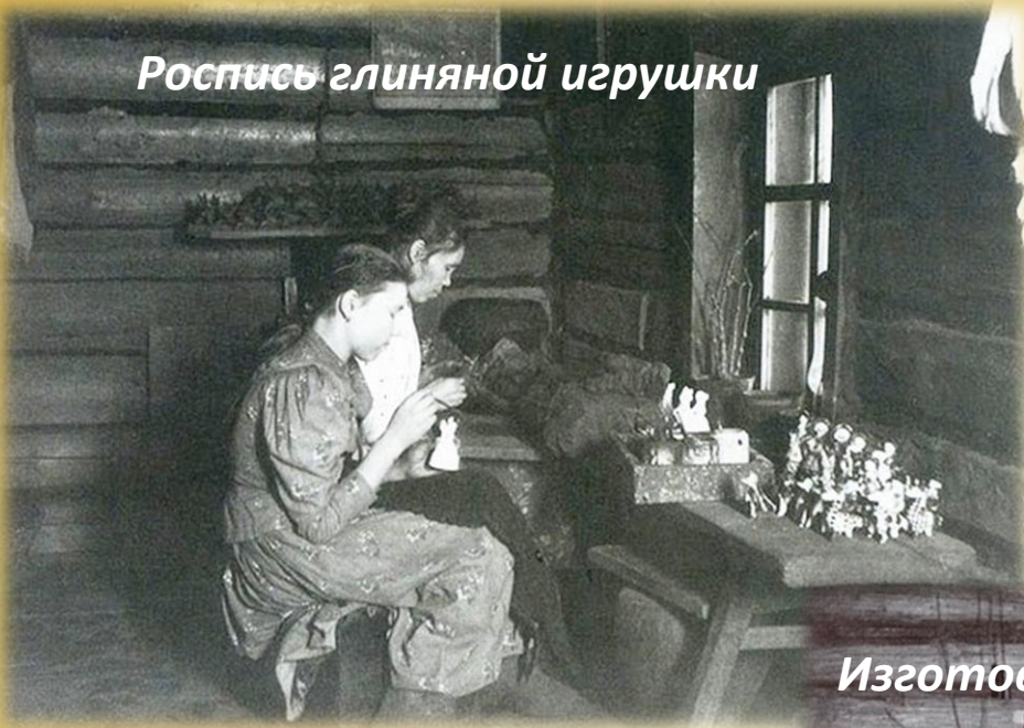
Роспись глиняной игрушки

Кроме изготовления обуви, одежды и посуды, важное место в русских народных промыслах играла игрушка. Именно ее считали очень важной для воспитания детей и производили в огромных количествах в основном из глины и дерева.