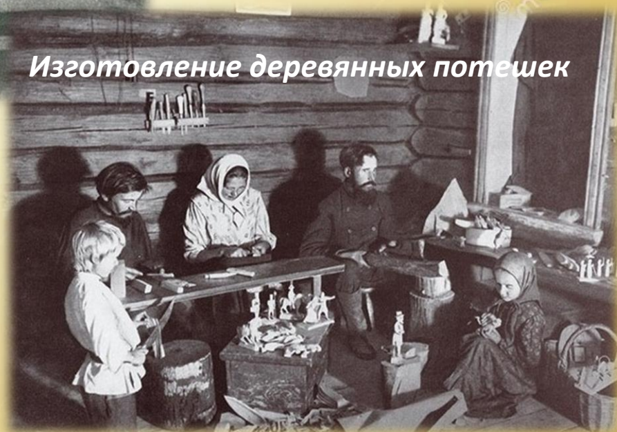
Изготовление деревянных потешек

Часто игрушки на Руси называли «потешками». Самыми популярными сюжетами для них были барышни, солдаты, коровы, кони, олени, бараны и птицы.