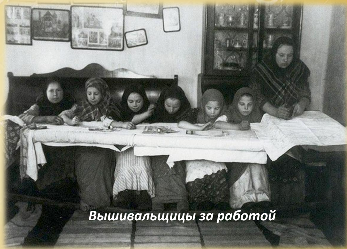
Вышивальщицы за работой

Беленную ткань часто украшали разнообразной вышивкой. Вышивать на Руси умели и девочки, и женщины. Этот вид народно-прикладного искусства считался одним из самых популярных. Вышивкой украшались полотенца, скатерти, покрывала, свадебная и праздничная одежда, церковное и монаршее облачение.