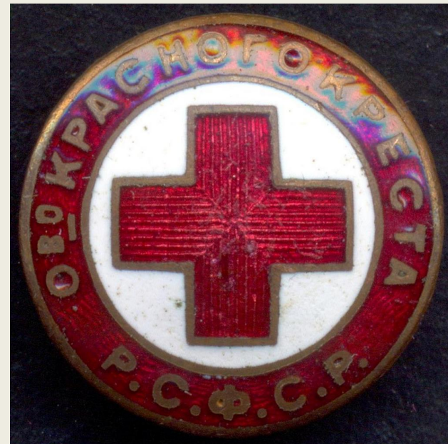
Общество Красного Креста РСФСР,