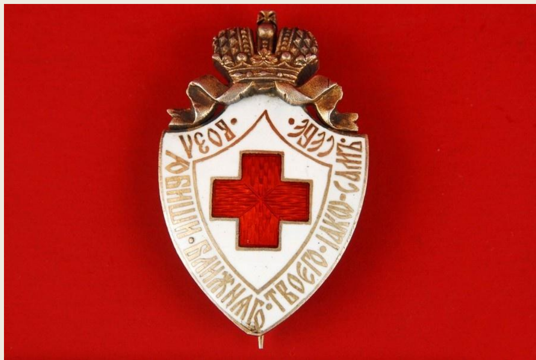
Знак Красного Креста утвержденный в 1899 году

Через 12 лет, в 1879 году, это общество переименовалось в Российское Общество Красного Креста. Переименование произошло потому, что круг обязанностей и полномочий общества расширился – ещё с 1872 года люди получали помощь Общества во время стихийных бедствий, а в 1878–1879 годах силы Общества были брошены на устранение эпидемий и их последствий. Так же переименование отметило установившуюся связь Общества с отделениями Красного Креста в других странах. Российская империя стала одной из первых стран в мире, где было создано общество Красного Креста, и на момент его создания в России имелся большой опыт оказания помощи пострадавшим от войн.