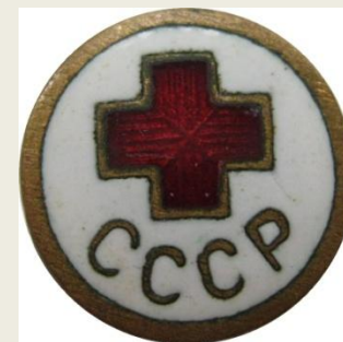
Нагрудный Знак "Общество красного креста»