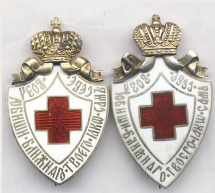
Знак Российского Императорского Красного Креста, им награждали сестёр Милосердия

Организация, подобная МККК, была основана в Российской империи в Санкт-Петербурге ещё в 1854 году по инициативе великой княгини Елены Павловны и Николая Ивановича Пирогова и получила название Крестовоздвиженской общины сестёр милосердия. В это время шла Крымская война, и её ужасы были в числе главных причин основания общины. Крестовоздвиженская община была первой в своем деле никто до сих пор не помогал раненым на поле боя, и вскоре первые 120 сестер милосердия, обученных самим Пироговым стали оказывать помощь на полях сражения. Сам великий хирург не раз отмечал, что оправка женщин на фронт была авантюрной идеей, исполненной им на свой страх и риск — армейские авторитеты противились присутствию женщин, а сам главнокомандующий царской армией А. С. Меншиков заявлял, что сестры милосердия хороши только для любовных утешений с солдатами.