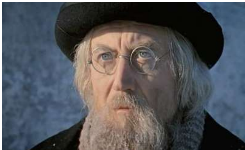
Евгений Евтушенко в роли Константина Циолковского

Успел проявить себя Евтушенко и в кино. Сценарий к киноленте "Я - Куба", которая вышла в 1964 году, Евгений Евтушенко написал в соавторстве с Энрике Пинеда Барнет. В картине Саввы Кулиша "Взлет" поэт исполнил главную роль Константина Циолковского. Картина вышла на экраны в 1979 году. А в 1983 году писатель попробовал себя в роли сценариста и поставил фильм "Детский сад", где сыграл небольшую роль. В 1990 году он написал сценарий и выступил режиссером фильма "Похороны Сталина".