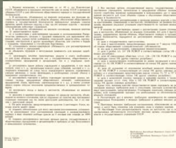
Указ о затемнении