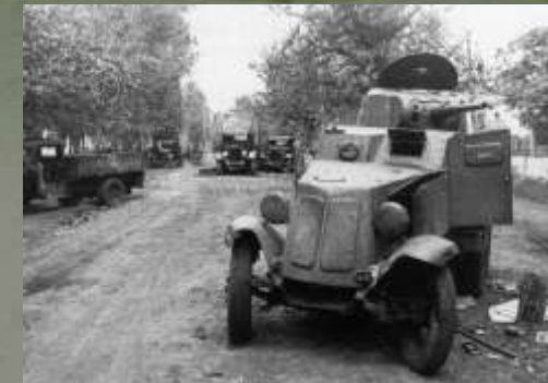
автомобили со специальными нафарниками