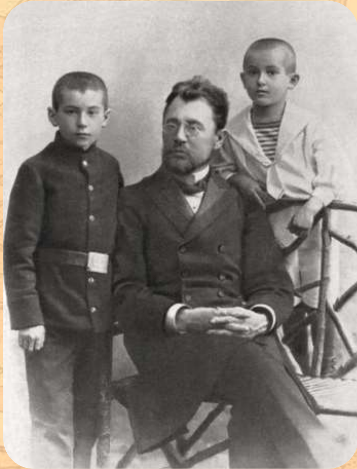
Валентин Катаев с отцом и братом

Семья Катаевых была интеллигентной и образованной. Отец происходил из семьи священника, получивший прекрасное образование, а мать - из древнего казацкого рода, была дочерью высокопоставленного генерала. Родители увлекались литературой и искусством. Наличие в доме огромной библиотеки и ежевечерние чтения вслух открывали пути во множество миров. Любовь к русской литературе была у Валентина с детства, любимыми писателями были Пушкин, Л. Толстой, Чехов. Образование свое Валентин начал в Одесской гимназии. По его воспоминаниям, он постоянно пребывал в творческом возбуждении, пытался выплеснуть на бумагу мысли и чувства, которые теснились в голове. И в десять лет пишет свои первые стихи. Некоторые из них были напечатаны в одесских газетах, а в 1914 впервые стихи Катаева опубликовали в Петербурге в журнале "Весь мир". Одно из его первых стихотворений Весенний туман: