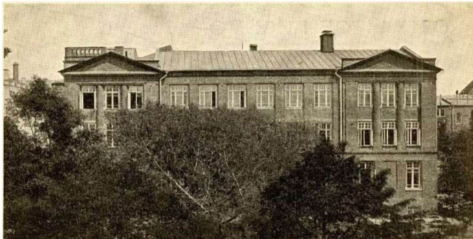
Московская Мужская гимназія Д. А. Лебедева.

Москва, Б. Каменщики, домъ 7. Телеф. гимназіи 2-48-47.