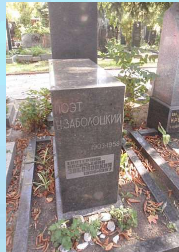
Могила Заболоцкого на Новодевичьем кладбище Москвы