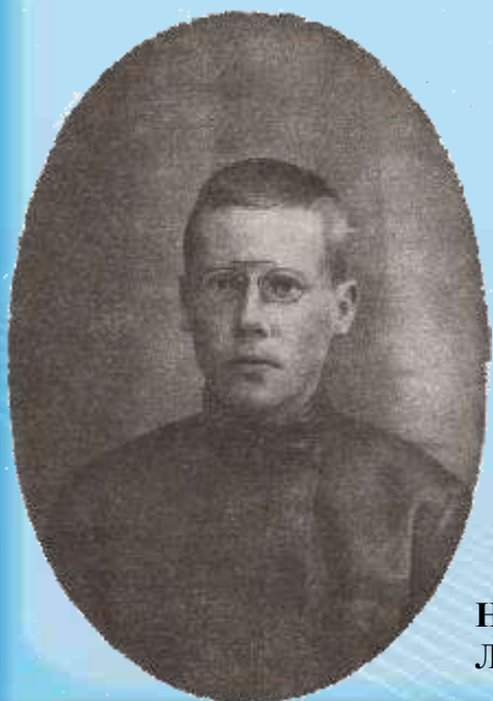
Николая Заболоцкого Ленинград 1921 год

Родился Заболоцкий 24.04.1903 в Казанской губернии, Кизической слободе, Вятской губернии. Сейчас это республика Марий Эл. Позже многие отмечали характерный северный говор, прорывавшийся в речи поэта – ведь именно оттуда был родом Николай Заболоцкий. Его детство прошло на фермах, в деревнях и селах. Отец – агроном, мать – сельская учительница. Жили они сначала в Казанской губернии, потом переехали в село Сернур. Литературный талант Заболоцкого проявился еще в раннем возрасте. В третьем классе школы он делал рукописный журнал, в котором размещал свои стихотворения. В 1913 году Заболоцкий поступил в реальное училище в Уржуме. Поэт увлекается химией, историей, рисованием, открывает для себя творчество Блока. В 1920 году Заболоцкий поступает на медицинский факультет Московского университета. Однако через полгода бросает учебу и возвращается домой. Вскоре переезжает в Петроград и поступает в Педагогический институт имени Герцена на отделение языка и литературы. В 1925 году оканчивает вуз.