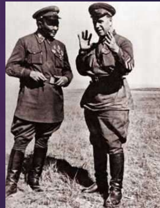
Георгий Жуков (справа) и маршал Чойбалсан. Халхин-Гол.