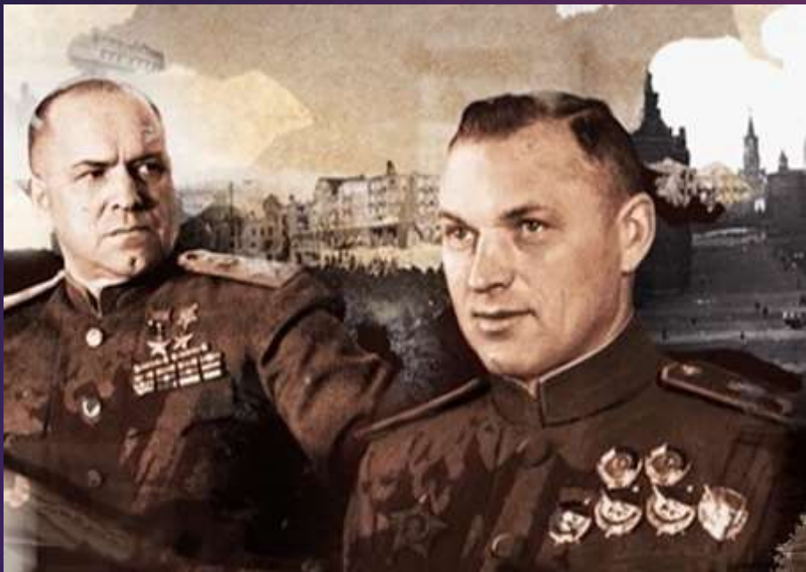
Жуков и Рокоссовский".