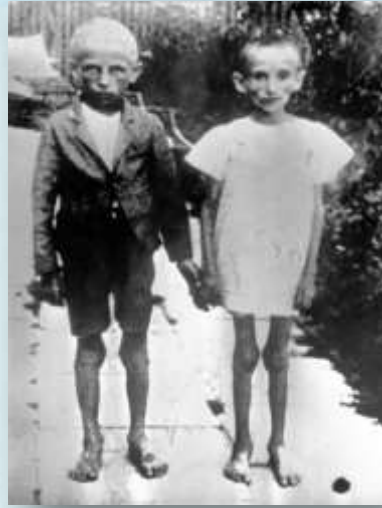
Дети, освобожденные в Саласпилсе