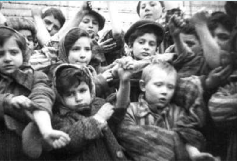
Дети Маутхаузена показывают выколотые на руках номера