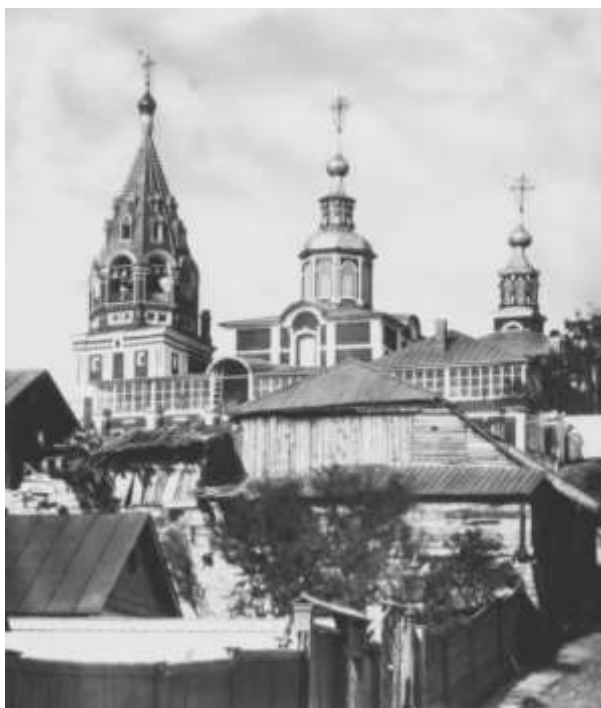
Храм Никиты Мученика на Швивой горке. 1882 год

Но особенно меня очаровал Храм Успения Пресвятой Богородицы в Гончарах своей миниатюрностью и сказочностью. Первые упоминания о церкви, еще деревянной и построенной в Гончарной Слободе, относятся к самому началу XVII века. В 1654 году Успенский храм выстроили уже из камня и украсили изразцами. Изразцы, сохранившиеся до сих пор, были изготовлены Степаном Полубесом, мастером гончарного искусства.