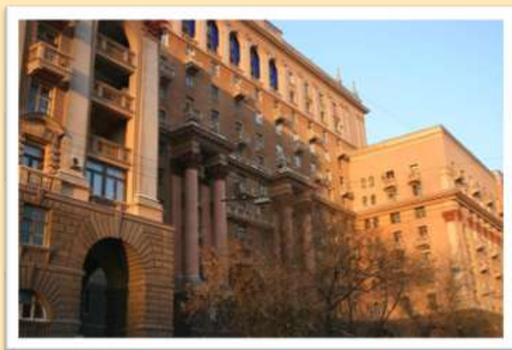
Гончарная улица, дом 38