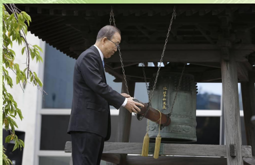
Генеральный секретарь Организации Объединенных Наций Пан Ги Мун звонит в "Колокол мира"