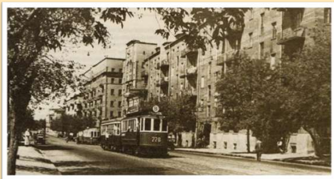
Воронцовская улица в сторону Таганской площади. 1947 г.