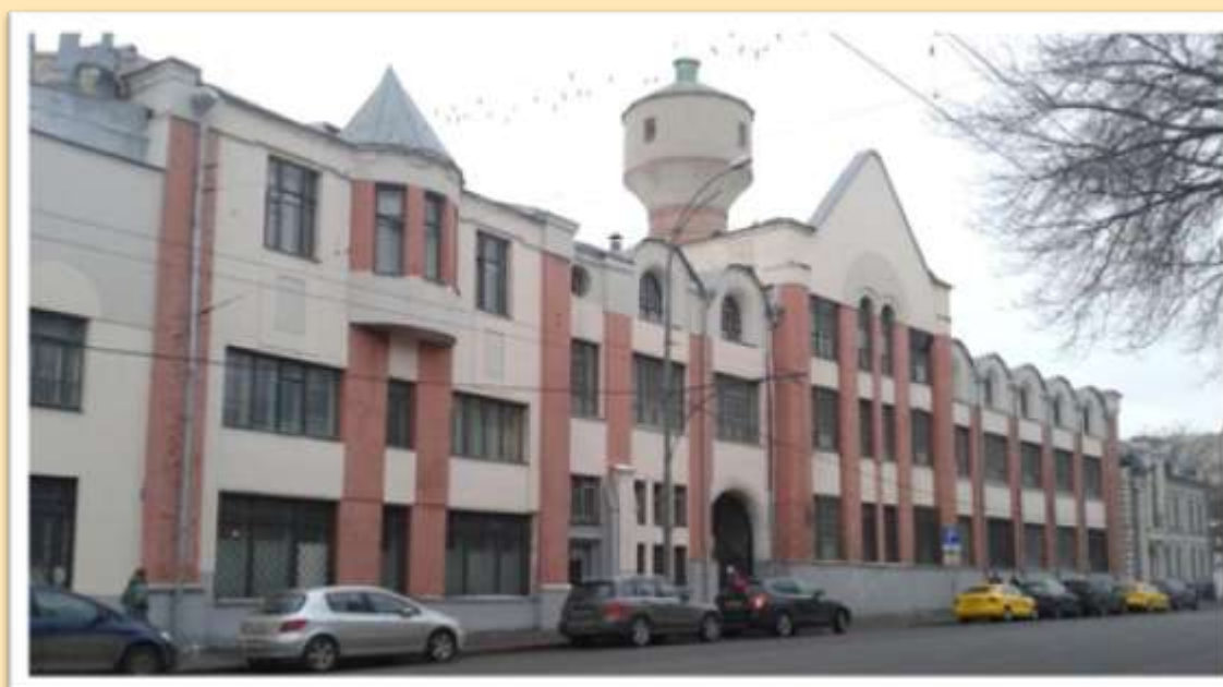
Улица Воронцовская, 10. Здание фабрики "Эрманс". Здание построена в 1907 году. Эрманс - это общество торговли аптекарскими и косметическими товарами