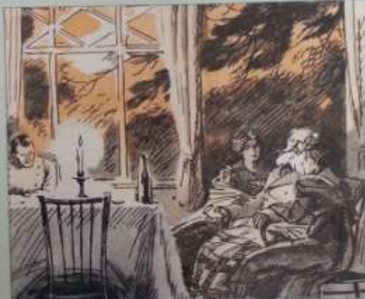
А.Иванов. Иллюстрация к рассказу «Гранатовый браслет»

В рассказе Куприна «Гранатовый браслет» много интересных фактов: это повесть о любви, о судьбе человека, о судьбе страны.