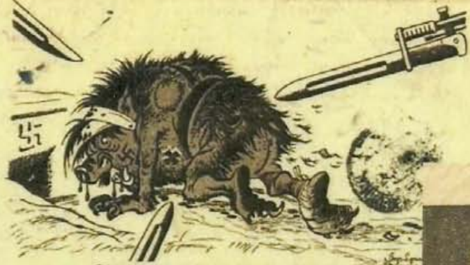
Фашистскому зверю закрыты дороги, Его мы прикончим в Берлинской берлоге! Вас, Лебедес-Бумач

Г променяла б все библиотеки, все в мире томики, томищи и тома а пару только слов о милом человеке, а треугольник маленький письма.