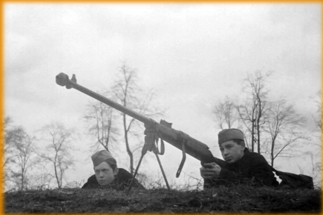
Истребители танков. Железнодорожный р-н, Москва