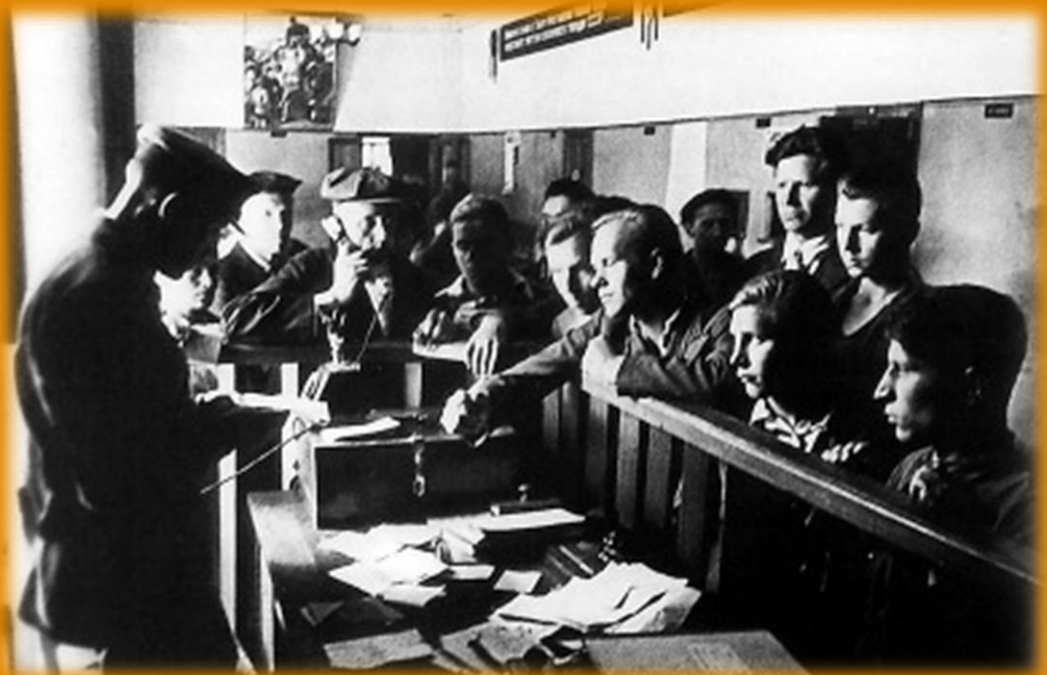
Запись добровольцев. Москва