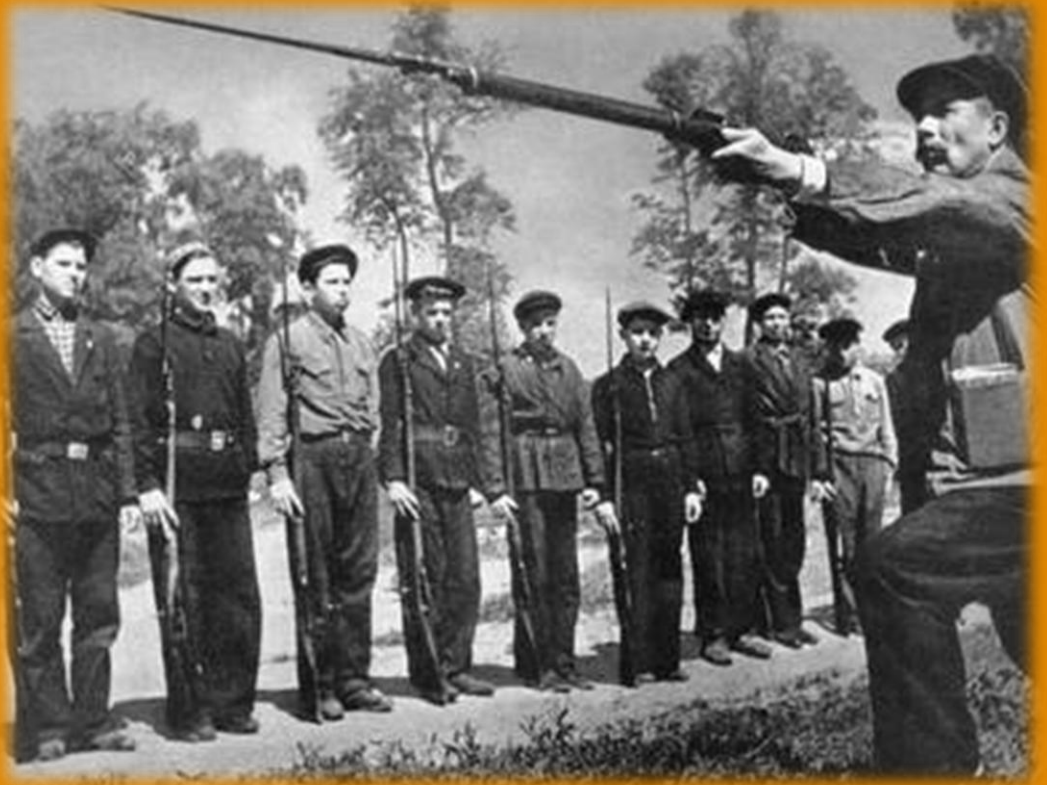
Ополченцы проходят психологическую подготовку к грядущим боям – обучение штыковому бою.