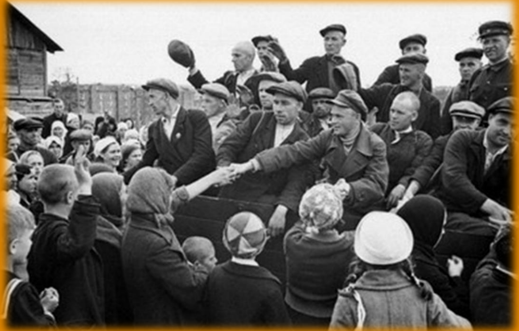
Мобилизованные в Красную Армию, отправляются в часть. Московская обл. 1941г.

Безусые, почти что дети, Мы знали в яростный тот год, Что вместо нас никто на свете За этот город не умрет.