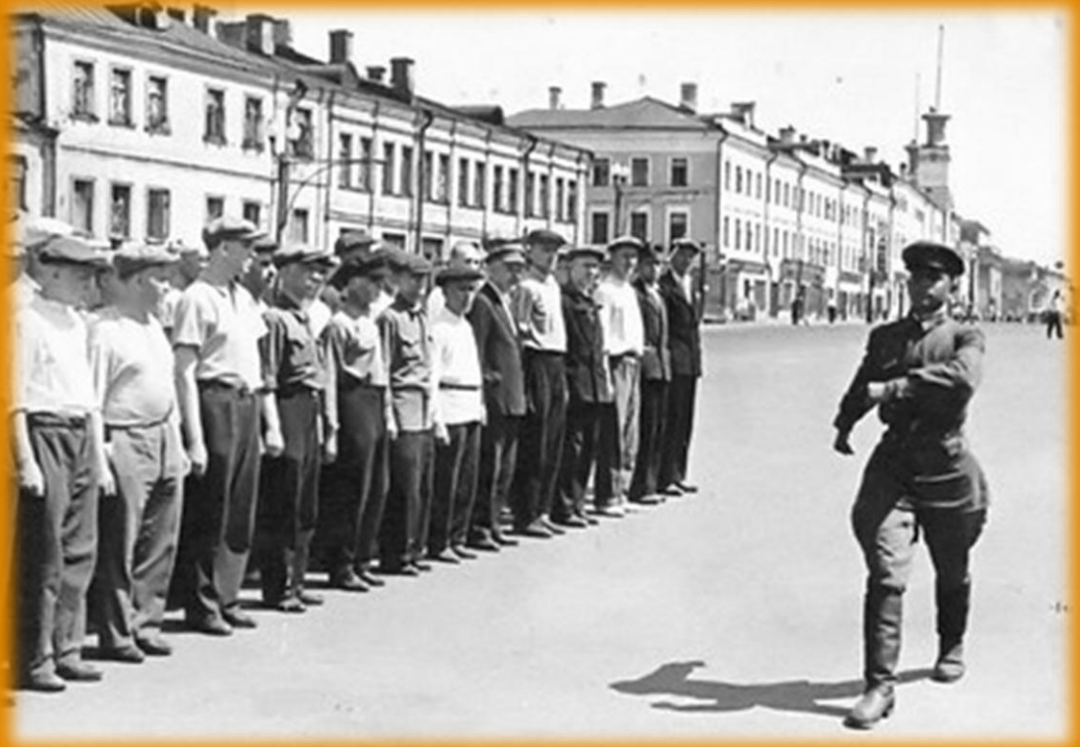
Занятия по строевой подготовке с ополченцами. 1941г.