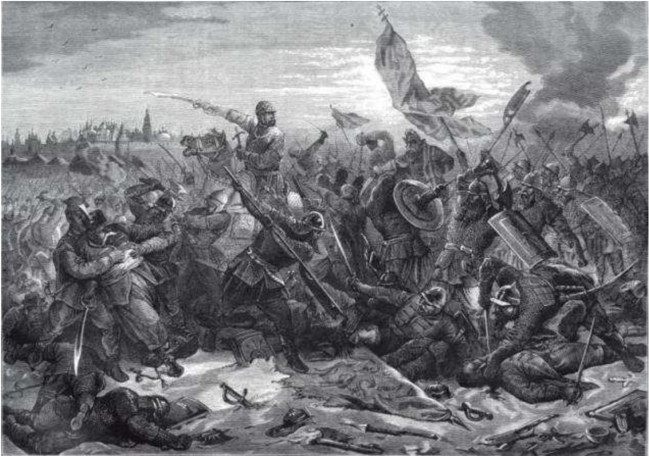
Битва князя Пожарского с гетманом Ходкевичем под Москвой

Второе народное или второе земское ополчение — возникшее в сентябре 1611 года в Нижнем Новгороде для борьбы с польскими интервентами. Продолжало активно формироваться во время пути из Нижнего Новгорода в Москву, в основном в Ярославле в апреле — июле 1612 года. Состояло из отрядов горожан, крестьян центральных и северных районов России. Руководители — Кузьма Минин и князь Дмитрий Пожарский. В августе 1612 года с частью сил, оставшихся под Москвой от Первого ополчения, разбило польскую армию под Москвой, а в октябре 1612 года — полностью освободило столицу от оккупации интервентами.