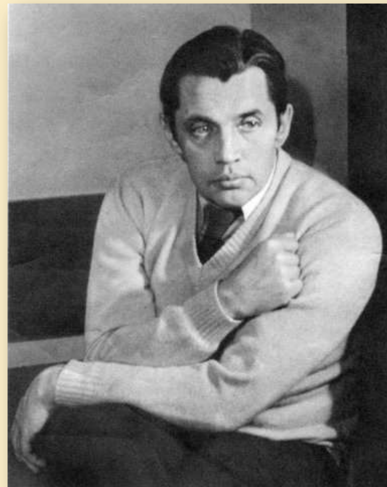
Роберт Иванович Рождественский

Родился в с. Косиха Алтайского края в семье военнослужащего. В девять лет оказался в детском доме - родители ушли на фронт. Учился на историко-филологическом факультете Петрозаводского университета (1950-1951), окончил Литературный институт им. М. Горького (1951-1956). Известен как поэт, переводчик, автор статей о поэзии. Стихи Р. Рождественского переведены на многие иностранные языки.