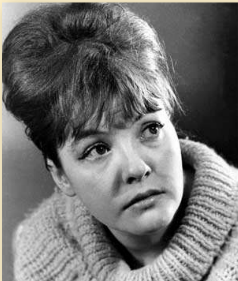
Белла Ахатовна Ахмадулина