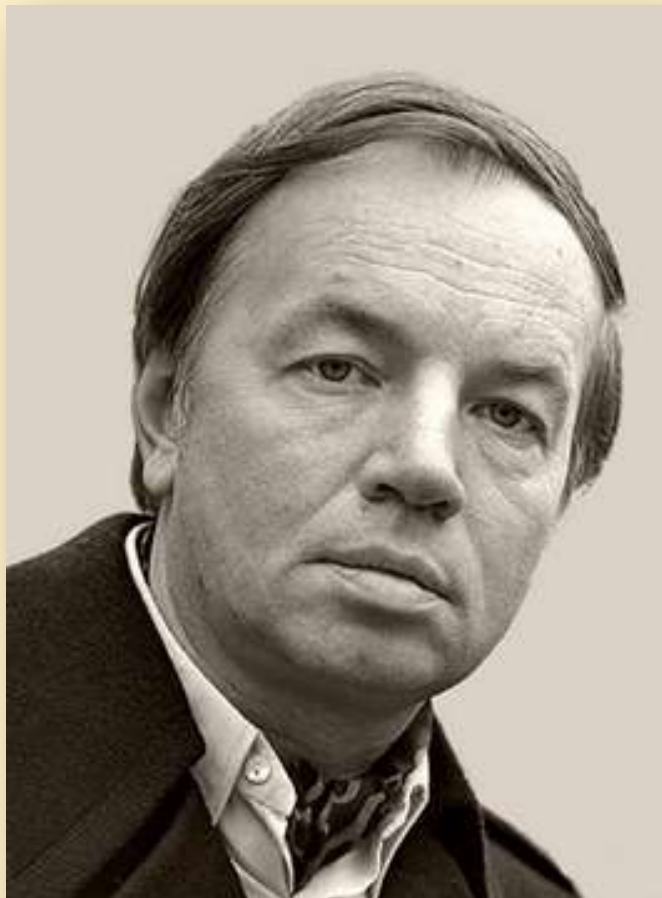
Андрей Андреевич Вознесенский