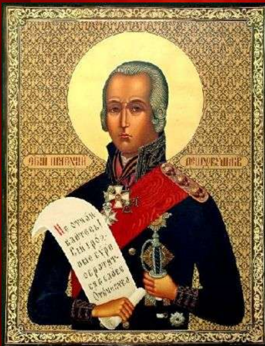
Святой праведный воин флотоводец Феодор (Ушаков)

Могила адмирала была восстановлена и вместе с остатками монастырского комплекса взята под охрану государства.