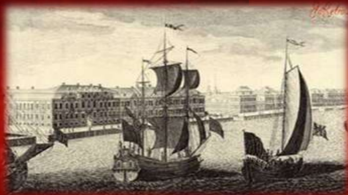
Санкт-Петербург, набережная лейтенанта Шмидта, 17, Здание Морского кадетского корпуса

Как только мальчику исполнилось 16 лет, он был направлен в Морской Шляхетский корпус кадетов, где отличился успехами в области истории и военных наук. Фёдор Фёдорович окончил петербургский корпус четвертым по успеваемости. В 1763 году Ушаков становится гардемаринном, а год спустя капралом. В 1766 году Фёдор окончил морской кадетский корпус и пошёл служить на Балтику мичманом.