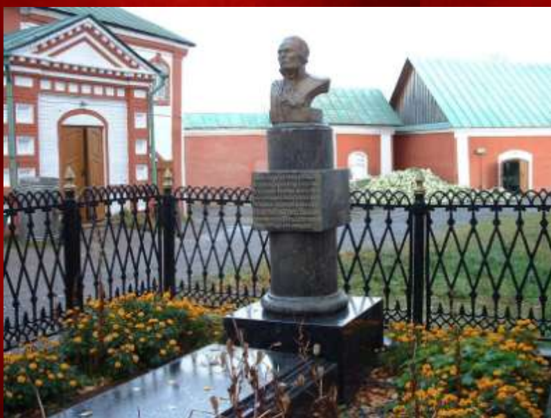
Могила Ф.Ф. Ушакова.

В послереволюционные годы Санаксарский монастырь закрыли. Часовню, выстроенную над могилой адмирала, разрушили. В годы Великой Отечественной войны был учрежден орден его имени и возник вопрос о месте погребения адмирала. Была создана государственная комиссия, которая произвела вскрытие могилы адмирала на территории монастыря у стены соборного храма. Останки оказались нетленными, что было зафиксировано в соответствующем документе комиссии. По мнению Священного синода, данный факт является доказательством святости человека.