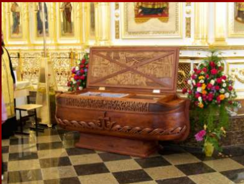
Мощи Ф.Ф. Ушакова в соборном храме Рождества Богородицы Санаксарского монастыря.