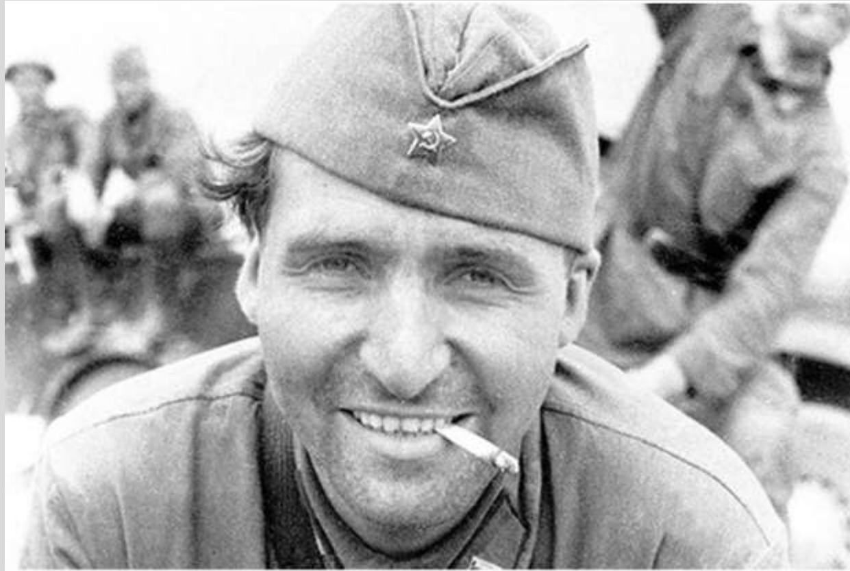
Константин Симонов на Халхин-Голе, 1939.

«Я был там, где пахло порохом и потом, где смерть ходила по пятам...»