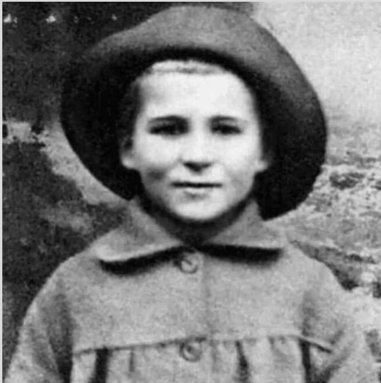
Константин Симонов в детстве

Россия рушилась и рождалась заново. Детство — в военных госпиталях, переездах, чужих именах. Отец — офицер царской армии, мать — из семьи дворян. Один — в ссылке, другая — в бегах. Но в этом хаосе мальчик научился слушать тишину войны... и слышать голос поколения.