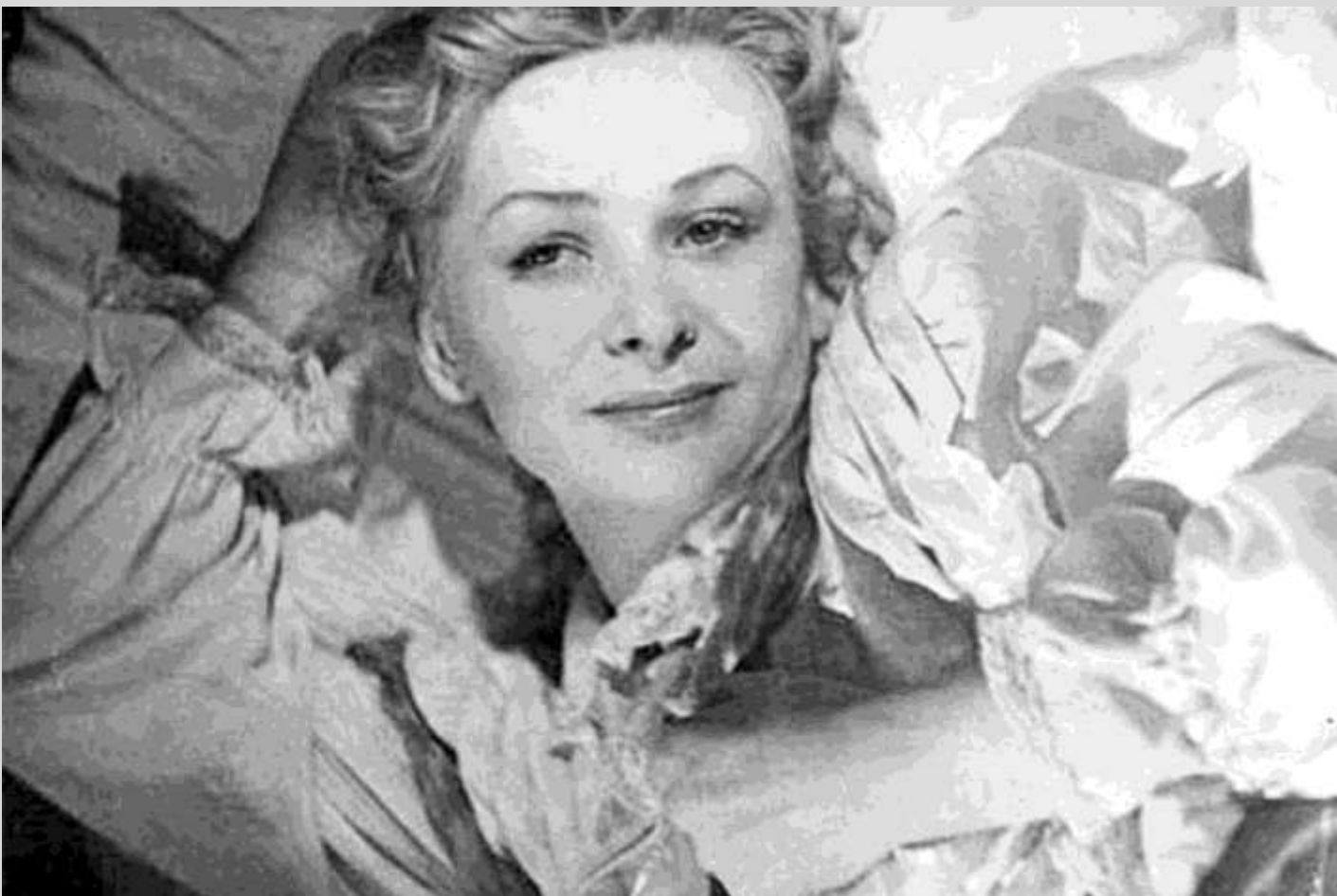
Валентина Серова - женщина всей жизни Константина Симонова.