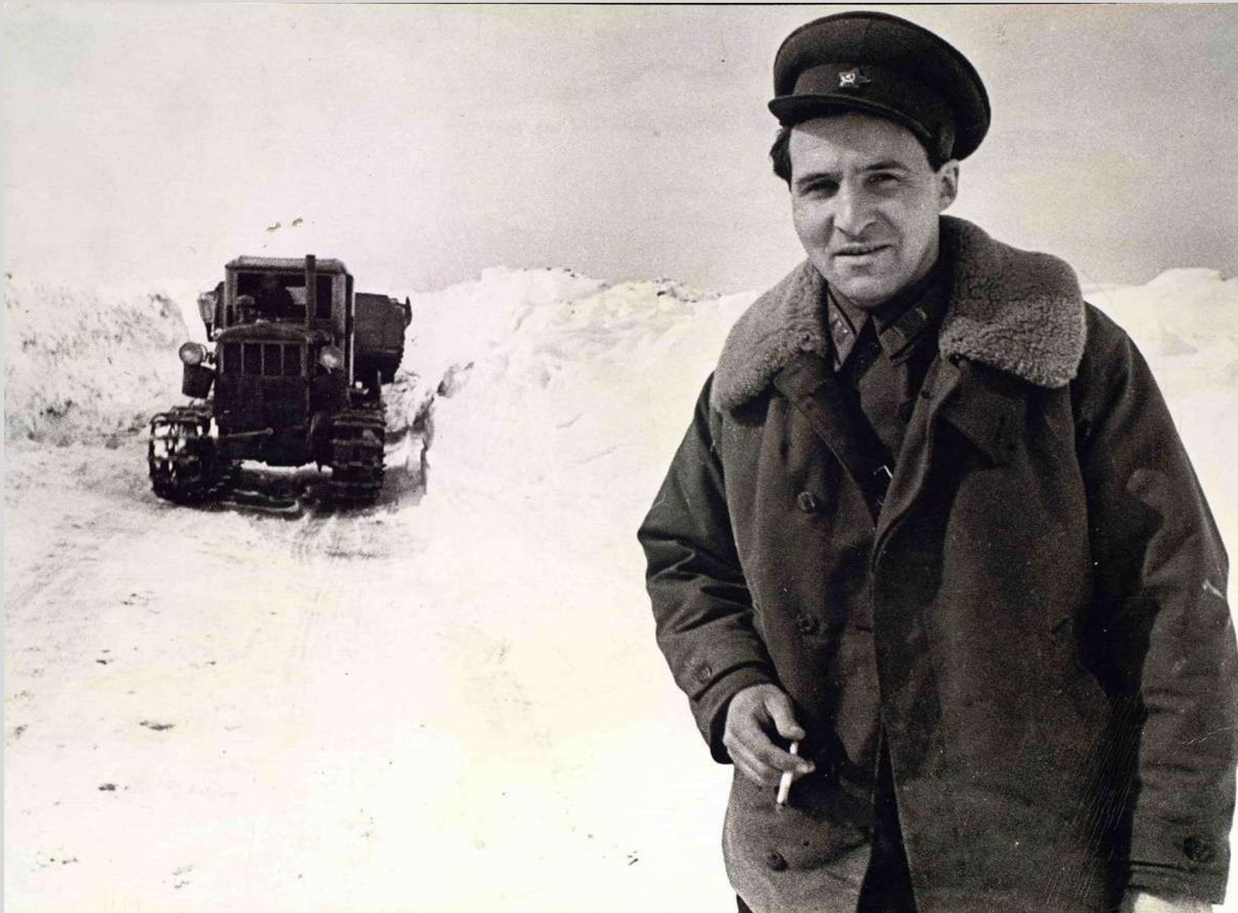
Константин Симонов на пути в Западную Лицу, 1941 год