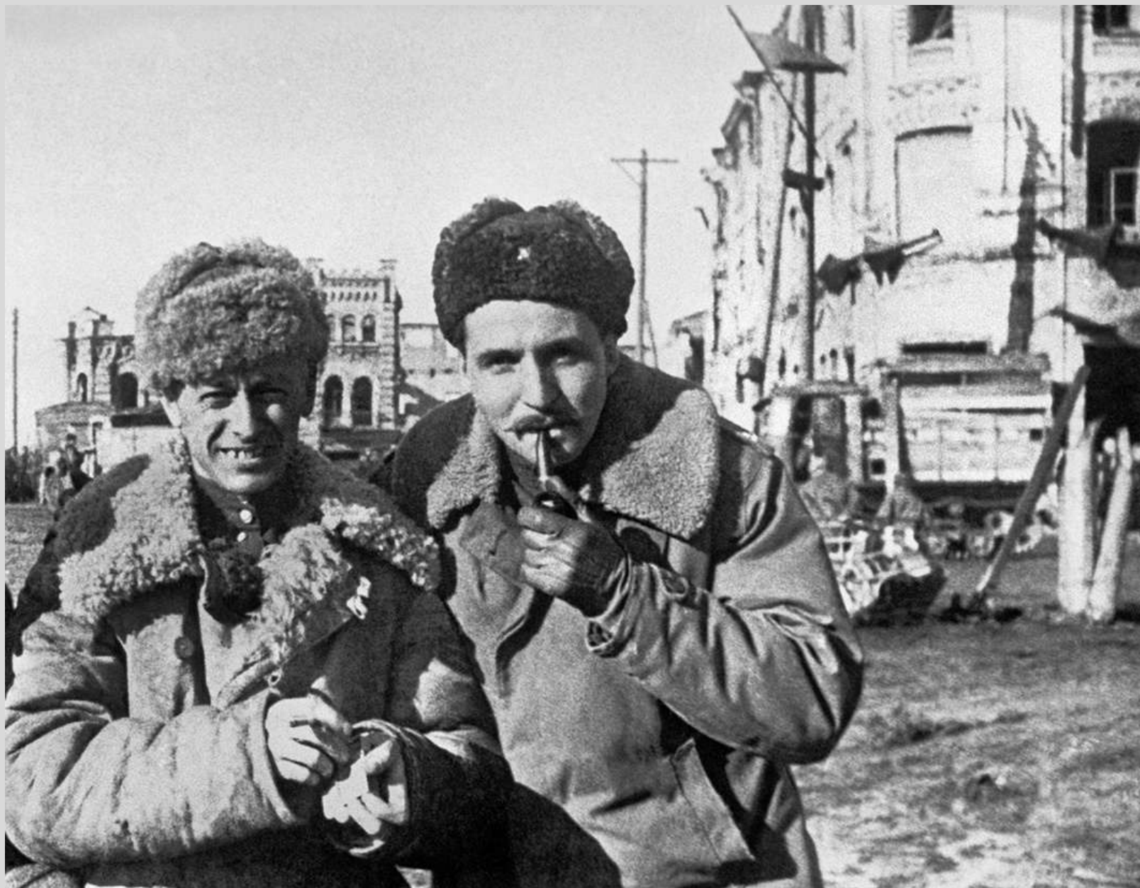
Кинооператор Роман Кармен (слева) и военный журналист Константин Симонов, Вязьма, 1943 год.