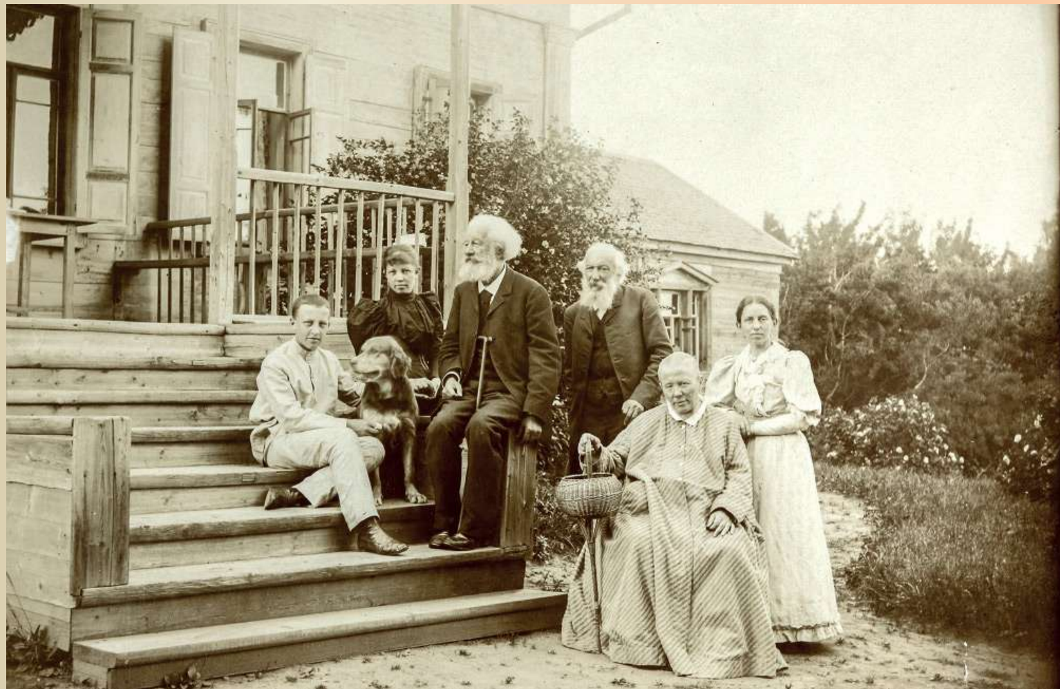
Семья Блока, 1984 год