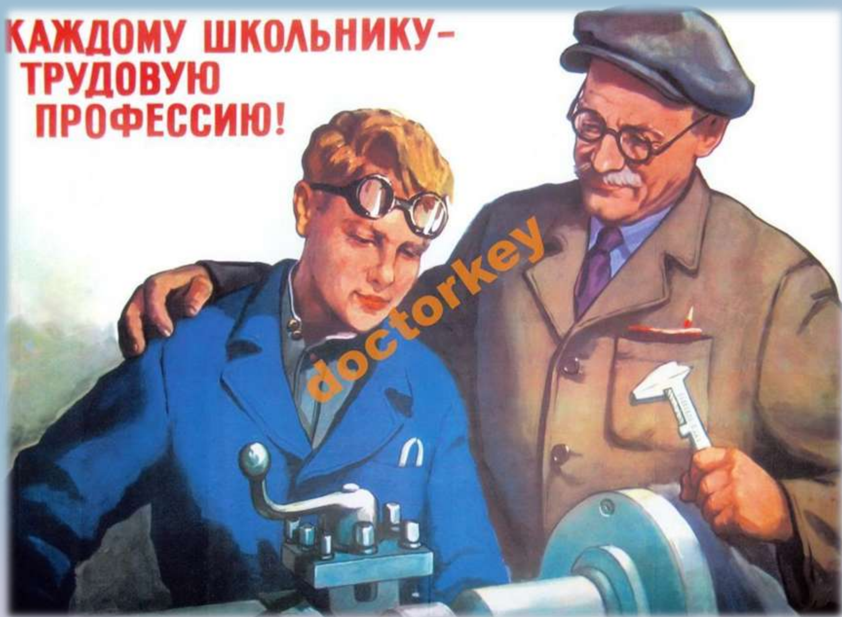
Царёв В.Г. Каждому школьнику - трудовую профессию! 1958.