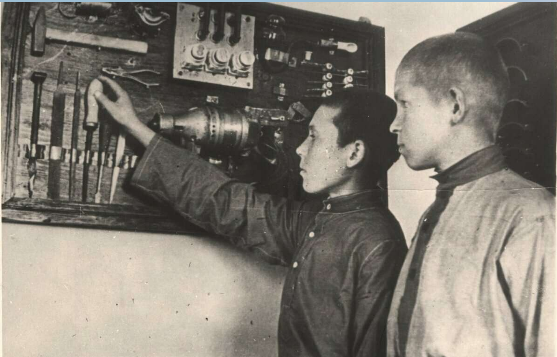
Первый призыв трудовых резервов. 1940 год