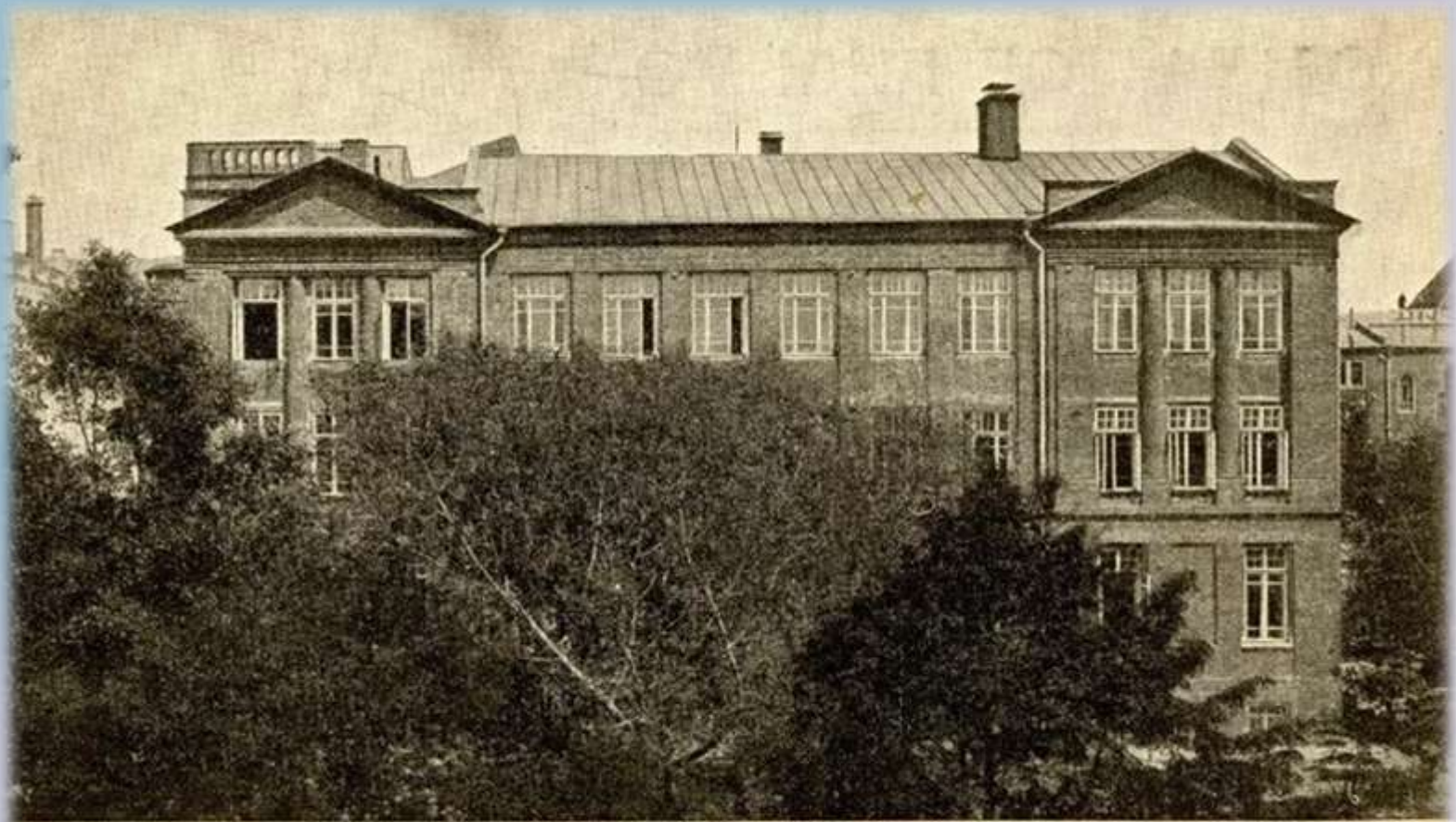
Московская Мужская гимназія Д. А. Лебедева.

История Колледжа начинается с 1912 года, где по адресу Москва, Большие Каменщики, дом 7 располагалась 28-я частная мужская гимназия Д.А. Лебедева