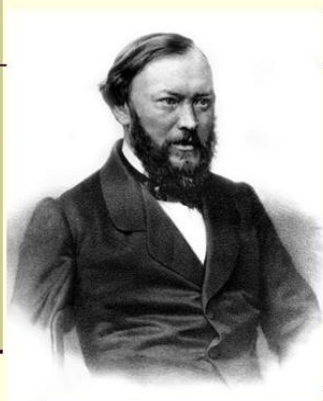
• А.Н. Островский