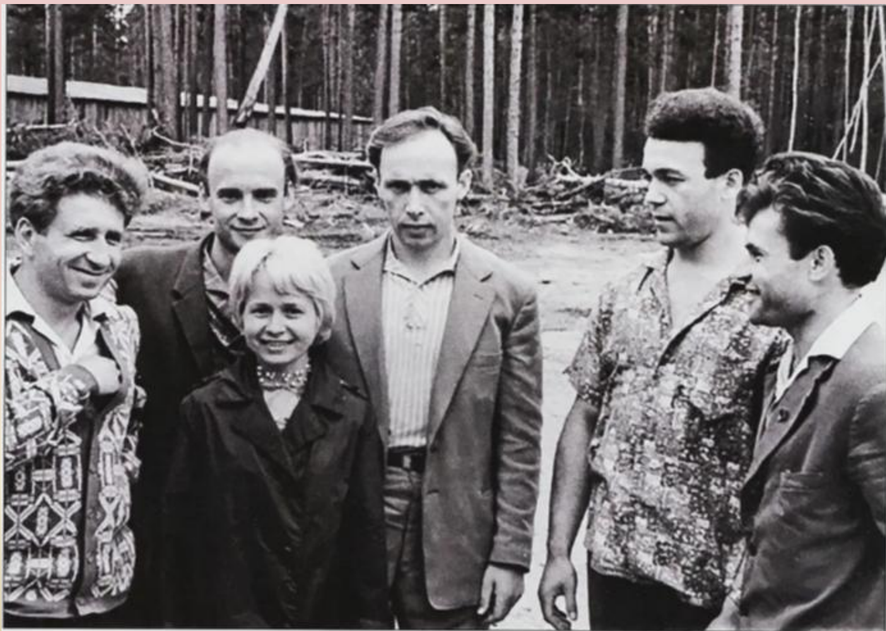
Фред Юсфин, Николай Доброправов (второй слева), Александра Пахмутова, Носиф Кобзон и Виктор Кохно (справа) в Братске