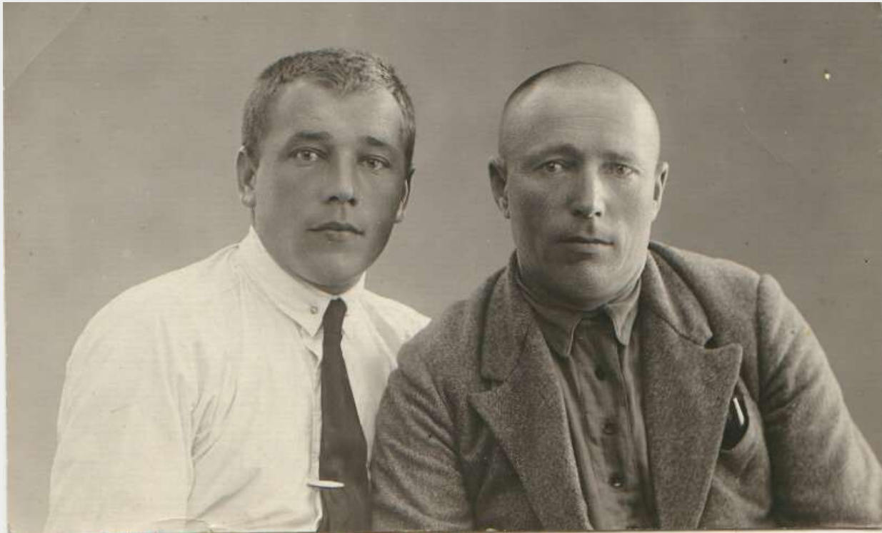
дядя и отец