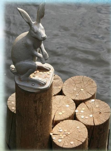
Памятник Зайцу в Петропавловской крепости в Санкт Петербурге

В России до 18 века вообще не существовало такого понятия, как "памятник". Охранялись государством и почитались народом только религиозные святыни. К сожалению, значительная часть произведений древнерусского искусства была утрачена в результате многочисленных пожаров и войн. К уничтожению памятников истории приводили также резкие смены идеологического курса в стране. В 1966 году было образовано Всероссийское общество охраны памятников истории и культуры. Данная общественная организация объединила в себе многочисленных любителей старины и истории. В 1976 году был принят закон, касающийся вопросов охраны и использования исторических памятников «Об охране и использовании памятников истории и культуры».