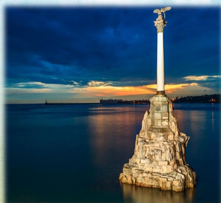
Памятник затопленным кораблям в Севастополе