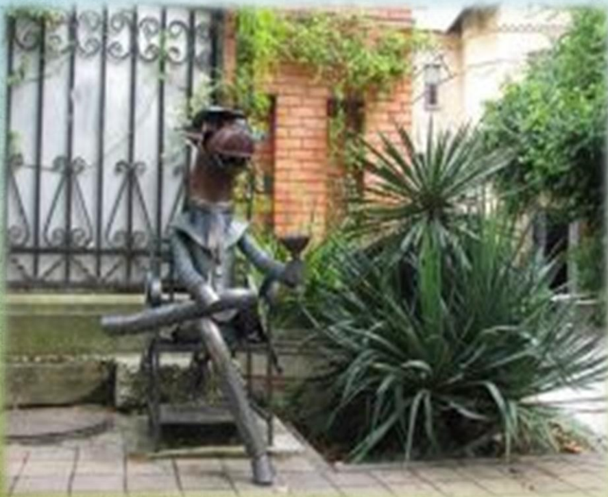
Сочи. «Конь в пальто»

Необычные памятники – это предмет гордости скульпторов, восторга горожан, объект охоты туристов. Памятники могут производить самое разное впечатление: удручающее, пугающее, вдохновляющее, удивляющее. В Международной день памятников и исторических мест интересно найти самый забавный российский памятник.