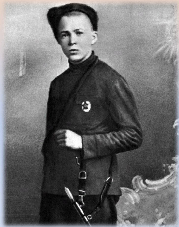
Аркадий Голиков в юности

В 1919 году пятнадцатилетнего бойца отправили в Киев на курсы красных командиров. Однако обучение часто прерывалось: студенты отбивали атаки украинских атаманов. В августе начал наступление Симон Петлюра. Аркадий Голиков вспоминал: «Прошел 300 верст в составе арьергарда, прикрывавшего <...> отступление наших войск, и вышел к Гомелю с ротой курсантов в семнадцать человек из ста восьмидесяти» . Отец будущего писателя в это время воевал на Восточном фронте против Александра Колчака, мать — вступила в Арзамасе в партию большевиков. В 1920 году Аркадий Голиков стал командиром роты. Воевал на Кавказе, потом в Средней части России: Воронеже, Нижнем Новгороде, участвовал в подавлении крестьянского восстания в Тамбовской губернии. Был дважды ранен.