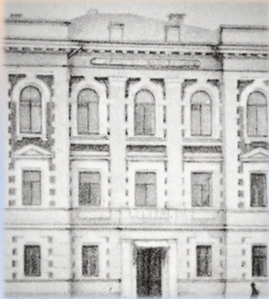
Здание Арзамасского реального училища, в котором с 1914 по 1918 год учился Аркадий Голиков