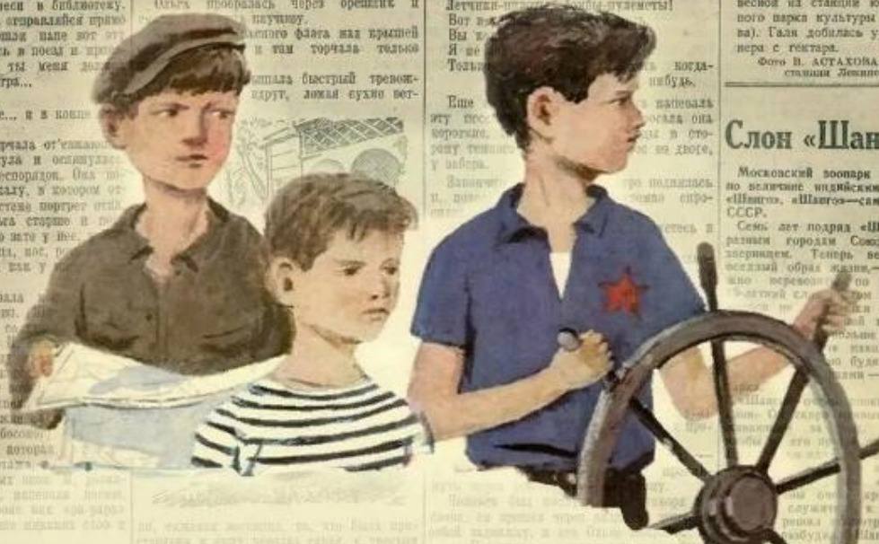
(детская театральная студия Ленинского района, Москва)