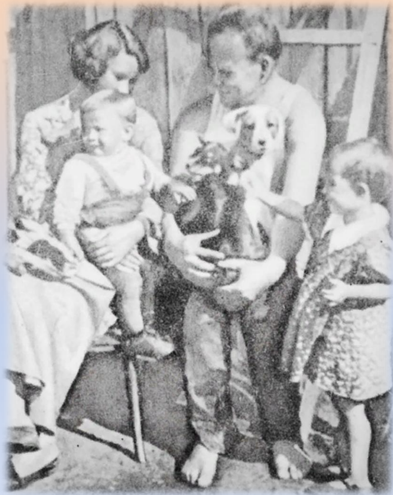
Аркадий Гайдар с женой Дорой. Клин, 1940 год

Осенью 1938 года Аркадий Гайдар перестал работать журналистом и переехал в город Клин. Писатель снимал дачу у семьи Чернышовых и познакомился с дочерью хозяина дома — Дорой. Она стала третьей женой Гайдара. В 1938 году литератор написал повесть "Судьба барабанщика". Повесть напечатали сразу два известных детских издания: журнал «Пионер» и газета «Пионерская правда». Главы также читали в эфире Всесоюзного радио. В феврале 1939 года Гайдара наградили орденом «Знак Почета» за «выдающиеся успехи и достижения в развитии советской художественной литературы».