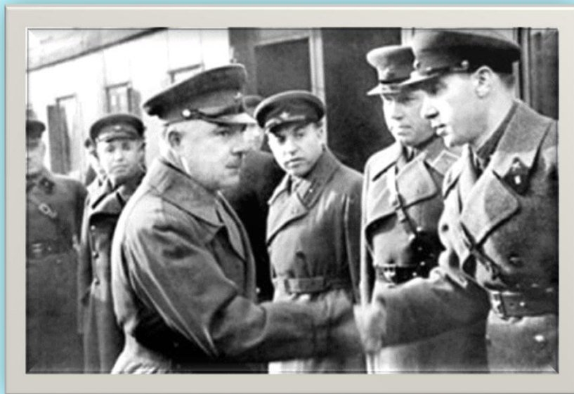
Народный комиссар обороны СССР Климент Ворошилов пожимает руку капитану Илье Старинову. 1937 год.

Ещё в годы Гражданской войны он обратил внимание на то, что «адские машины» для подрыва железных дорог являются слишком тяжелыми, громоздкими и неэффективными. В 1920-х года