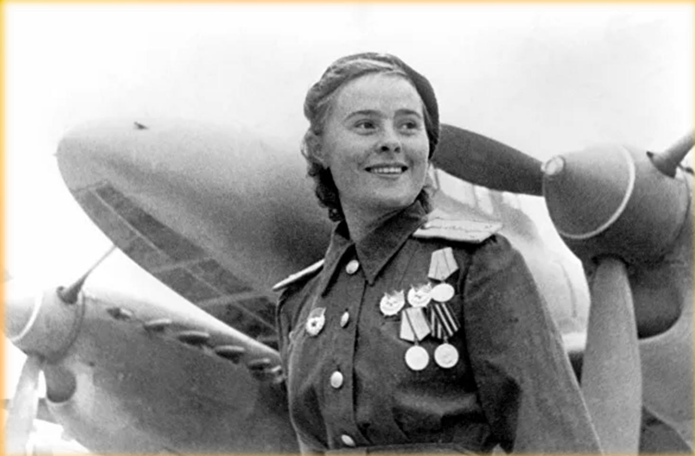
На фото: Герой Советского Союза заместитель командира эскадрильи 125-го гвардейского авиаполка Мария Долина

Сформированный Мариной Расковой 125-й женский авиаполк, в отличие от 586-го, был бомбардировочным соединением. Его летчицы использовали пикирующие бомбардировщики Пе-2 и за годы войны сбросили на противника более 800 тонн бомб.