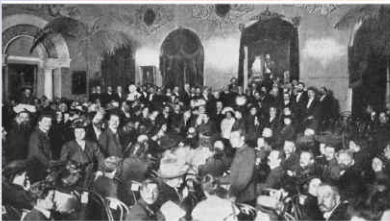
Торжественное заседание в актовом зале Московского университета

Празднование "профессионального" дня студентов имело традиции и ритуал – устраивались торжественные акты с раздачей наград и речами. Существовала и еще одна традиция: в этот день любому желающему позволялось зайти в университет, осмотреть аудитории и лаборатории, посетить библиотеки и музеи. Татьянин день отмечался и во времена СССР, ведь этот день совпадал с окончанием сессии.