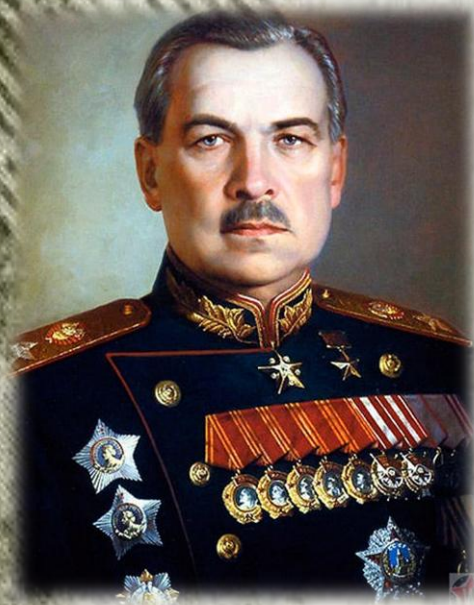
Леонид Александрович Говоров

Летом 1942 г. Леонида Говорова назначили командующим всеми силами Ленинградского фронта. Он много времени изучал разные схемы и строил расчеты для улучшения обороны. Говоров изменил месторасположение артиллерии, что повысило дальность стрельбы по позициям противника.