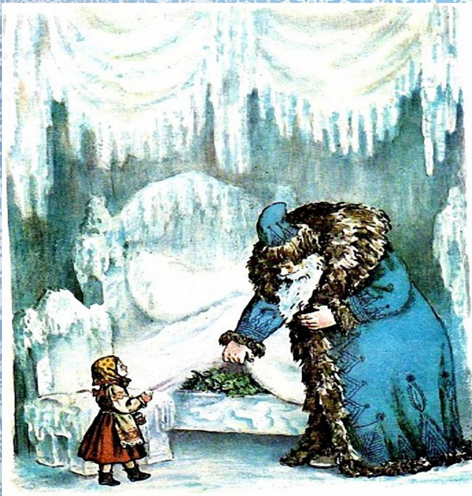
Владимир Конашевич. Иллюстрация к сказке В. Одоевского «Мороз Иванович». 1954 год.

Писатели вплетали в свои произведения эти сказания, предания, поговорки. Суровый дед добрел век от века, и вот уже не Трескун и Карачун, а благородный Мороз Иванович. Так уважительно прозвал главного героя своей сказки Владимир Одоевский. Не только зимой управлять, но и наставлять призван дедушка. Попали через колодец в ледяную страну Рукодельница и Ленивица. Поработать смогли и подарки получить. Не просто к празднику, а по заслугам. «Нам даром, без труда ничего не дается, недаром исстари пословица ведется», — рассказывает автор. С момента издания сказки в сборнике «Детские сказки дедушки Иринья» прошло уже 175 лет, а истина — как новая.