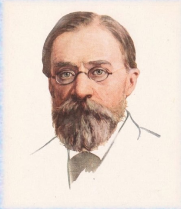
Александр Григорьевич Столетов