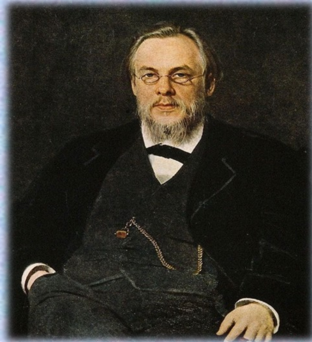
Сергей Петрович Боткин