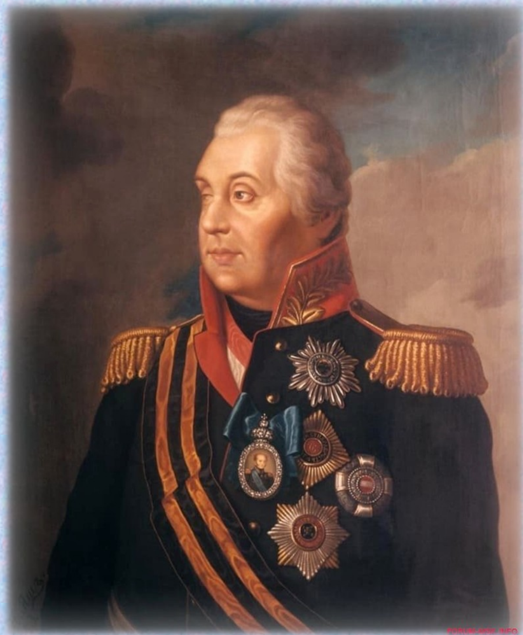
Михаил Илларионович Голенищев-Кутузов

Если и был в России более талантливый стратег, чем Кутузов, то только Суворов. Эти известные полководцы стали родоначальниками отечественной военной науки. Их стратегические и тактические приёмы до сих пор изучают в российских военных академиях.