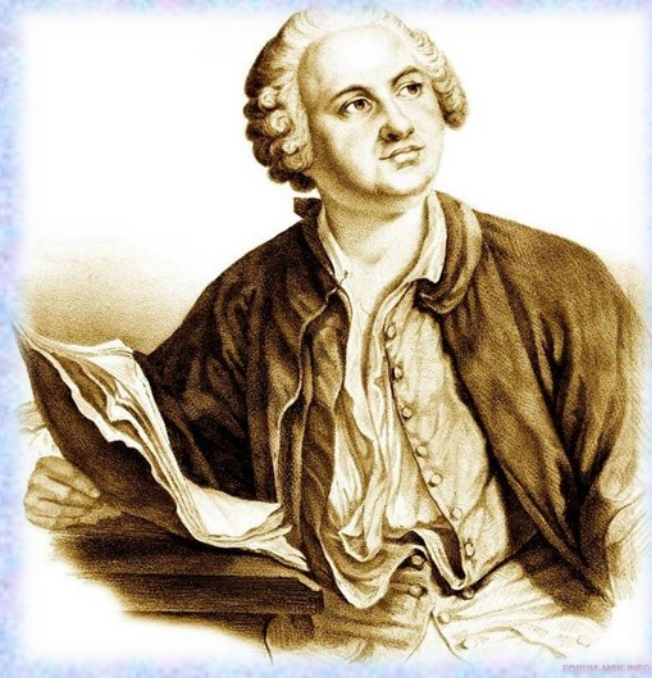
Михаил Васильевич Ломоносов