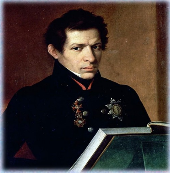
Николай Иванович Лобачевский

До появления на свет Менделеева страну прославляли другие деятели науки России – Николай Лобачевский и Михаил Ломоносов. Эти великие русские учёные сделали неоценимый вклад в математику и физику. Свои знания они с удовольствием передавали другим талантливым учёным, чем ещё больше способствовали развитию русского государства.