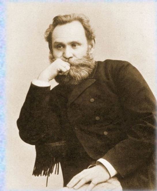
Иван Петрович Павлов