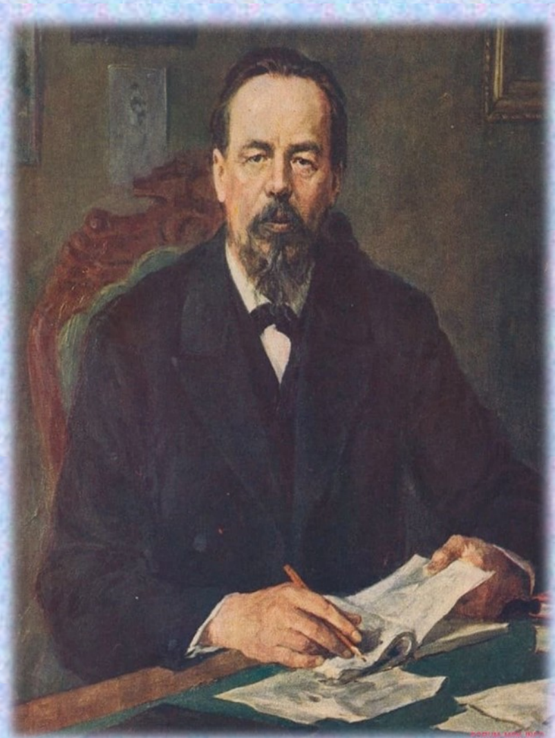
Александр Степанович Попов

Кроме этих столпов науки Россию прославляли и другие учёные. Физик Александр Попов, изобретатель первого радиоприёмника, физик Александр Столетов, создавший первый фотоэлемент, вирусолог Сергей Боткин, выявивший и описавший вирусный гепатит, антрополог Иван Павлов, известный своими исследованиями в области нервной деятельности. Все они заложили основы великолепного российского образования, которое ценится во всём мире.